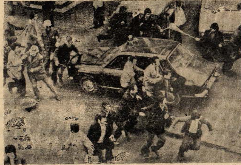
Resimde, Beko Teknikte çalışan işçilerin, İstanbul Adliye Sarayı önünde, polis tarafından dağıtılışı görülüyor.

Türk-İş Üçüncü Bölge temsilcisi ise, ölüm orucuna devam eden işçilerin DİSK'e bağlı sendikanın üyesi olduklarını, bu nedenle kendilerinin bu konuda fikir yürütmeve-