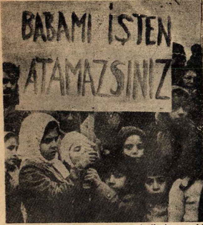
Epengle Kumaş Fabrikasında çalışan işçilerin çocukları da babalarının işten atılmasını protesto ettiler.

Açlık grevine devam eden işçilerden bir kısmı, hastalandıkları için hastaneye kaldırılmışlardır.